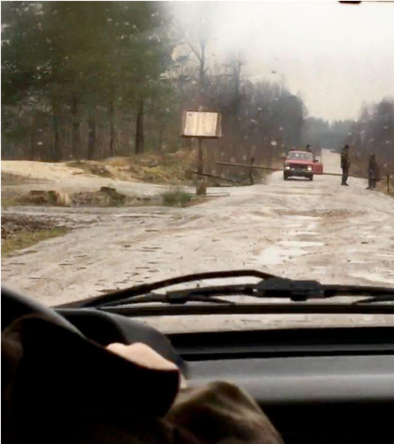
Качество фото плохое, но людей в форме Нацгвардии на снимке можно различить.